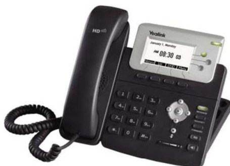
Model : SIP-T22P

Wsparcie BLF/BLA, przeglądarka XML, książka telefonu XML/LDAP, Hot Desking, programowalne przyciski, Auto provision, nagrywanie rozmów, call completion, lokalizacja językowa, SMS, Interkom, VLAN, QoS, VPN, SRTP/TLS/HTTPS, PoE, moduły sekretarskie.