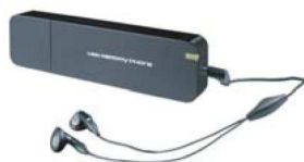
Model : USB-M3K

Giętki pałak nagłowny, duża poduszka nauszną, bardzo giętkie okablowanie mikrofonu pozwala nawet na 30 000 zmian ustawienia