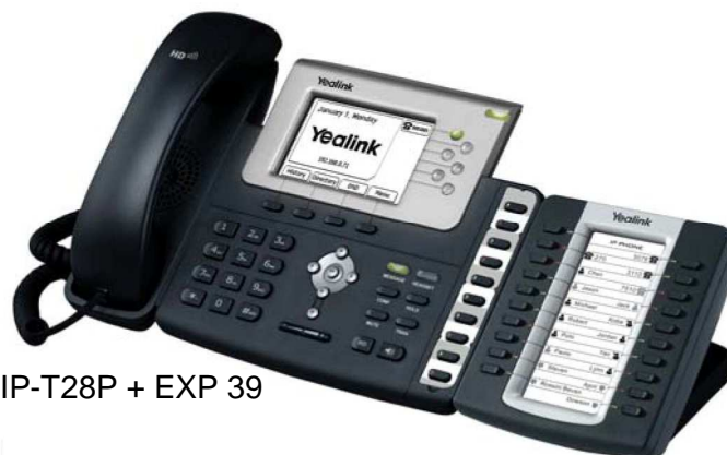
Model : SIP-T28P + EXP 39

Reklamy wideo mogą być odtwarzane podczas dzwonienia, rozmowy lub stanu bezczynności. Treść reklamy może być zarówno strumieniem wideo z wskazanego serwera jak i zawartością pamięci telefonu VP-2009P