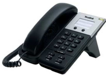
Model : SIP-T18P