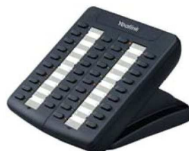
Model : EXP38

Wsparcie dla funkcji szybkiego wybierania, BLF/BLA, interkom, grupowe odbieranie, odbieranie bezpośrednie, konferencja, wstrzymanie, transfer, nasłuch grupowy, oddzwanianie, wiadomości głosowe.