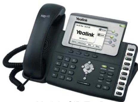
Model : SIP-T28P