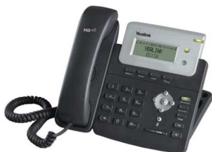
Model : SIP-T20P

Hot Desking, przeglądarka XML, książka telefonu XML/LDAP, programowalne przyciski, Auto provision, nagrywanie rozmów, call completion, lokalizacja językowa, SMS, Interkom, VLAN, QoS, 802.1x, IPv6, VPN, SRTP/TLS/HTTPS, PoE