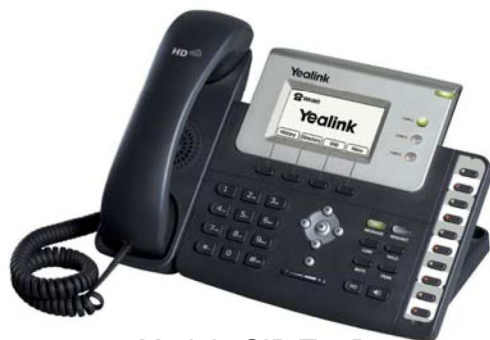
Model : SIP-T26P

Wsparcie BLF/BLA, przeglądarka XML, książka telefonu XML/LDAP, Hot Desking, programowalne przyciski, Auto provision, nagrywanie rozmów, call completion, lokalizacja językowa, SMS, Interkom, VLAN, QoS, VPN, SRTP/TLS/HTTPS, PoE, moduły sekretarskie.