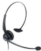
Model : YHS32

Wsparcie dla funkcji szybkiego wybierania, BLF/BLA, interkom, grupowe odbieranie, odbieranie bezpośrednie, konferencja, wstrzymanie, transfer, nasłuch grupowy, oddzwanianie, wiadomości głosowe.