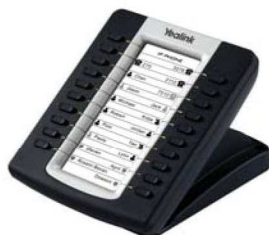
Model : EXP39

Transfer, wstrzymanie, redial, wyciszenie, szybkie wybieranie, rozmowy oczekujące, rozmowy awaryjne, hotline, regulacja głośności, wybór dzwonek, auto provision, poczta głosowa, WMI